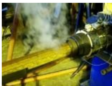
ФОТО ТОПЛИВНЫХ БРИКЕТОВ ИЗГОТАВЛИВАЕМЫХ НА ПРЕССЕ